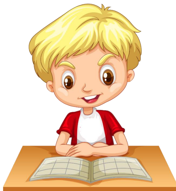
ILLUSTRATION designed by freepik

Cible a : Je serai capable de trouver l'intention de lecture, d'anticiper la suite et de valider l'intention de départ.